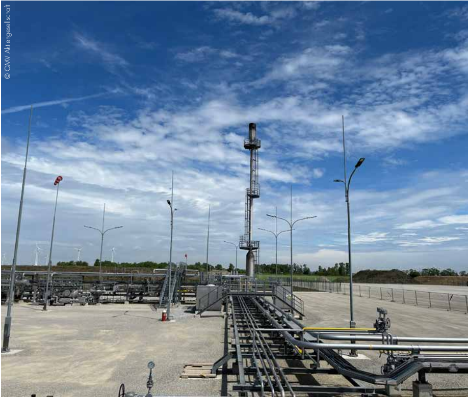
Die Gasproduktion Wittau von OMV stärkt die Versorgungssicherheit ihrer Kunden durch heimische Ressourcen und verdoppelt bei vollem Ausbau ihre Produktion in Österreich.

Die OMV startet drei Jahre nach der Entdeckung die Produktion ihres Gasvorkommens in Österreich und bringt den größten österreichischen Gasfund seit vier Jahrzehnten in Produktion.