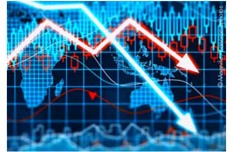
Die Folgen des Iran-Krieges belasten die Weltwirtschaft.

Die Auswirkungen des Iran-Krieges dämpfen auch in Österreich die Konjunktur. Laut