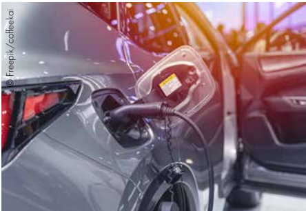
Moderne E-Autos können Reichweiten von 600 km und mehr erreichen.

Der März 2026 war ein guter Monat für die E-Mobilität: Jeder vierte neu zugelassene Pkw war rein batteriebetrieben. In absoluten Zahlen sind das 8.206 E-Autos (März 2025: 6.122). Diese erfreulichen Entwicklungen sind ein Hinweis darauf, dass die E-Mobilität zunehmend Fahrt aufnimmt. „Die Zuwächse bei den Neuzulassungen von E-Pkw sind erfreulich und ein klarer Hinweis darauf, dass die E-Mobilität in der Mitte der Gesellschaft angekommen ist. Angesichts der Herausforderungen auf den Energiemärkten durch die Krise im Nahen Os-