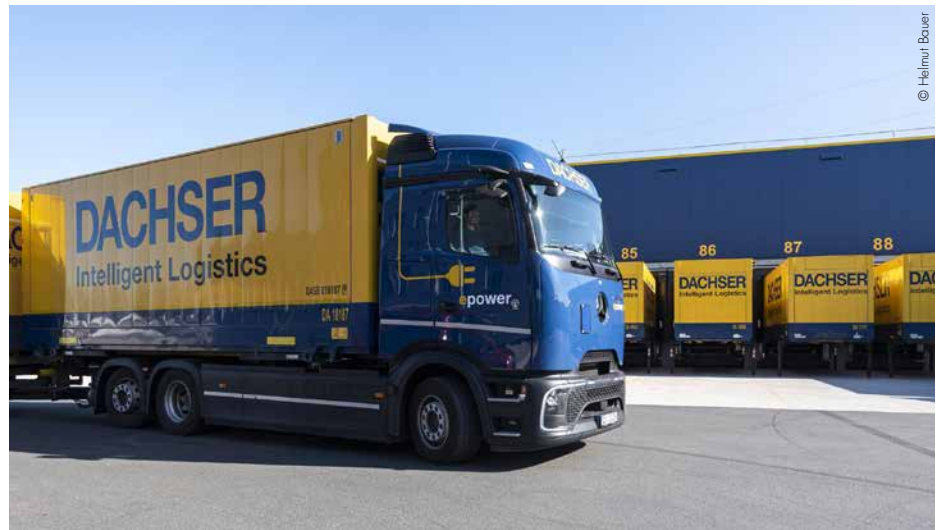
Dachser erreicht 2025 einen neuen Höchstwert in der Unternehmensgeschichte.

Besonders positiv entwickelte sich die Lebensmittellogistik. Begünstigt durch die Zukäufe erhöhte Dachser seinen Umsatz in der Business Line Food Logistics um 10,1 Pro-