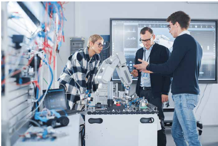
Immer komplexere Herausforderungen erfordern multidisziplinäre Lösungen und Co-Kreation.

Auf Produktebene zeigt sich, dass zunehmend Ökosysteme entstehen, die nicht auf die Produktwelt eines einzelnen Herstellers beschränkt sind. Ein typisches Beispiel: Kauft ein Maschinenbauer heute Verbindungstechnik für seine neue Maschinenreihe von einem Anbieter, so bekommt er