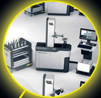
Einstellen und Messen