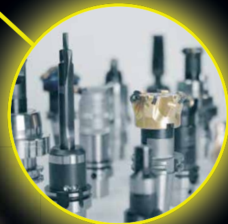
TMS Tool Management Solutions