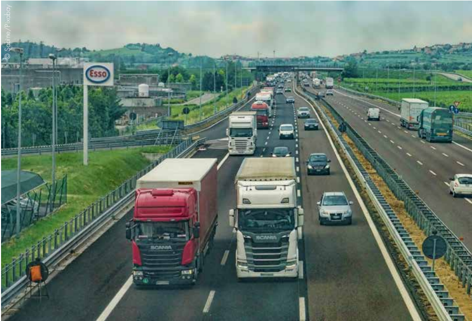
Die Logistik ist die volkswirtschaftlich sechstwichtigste Branche Österreichs.

Die Industriellenvereinigung, die Wirtschaftskammer Österreich und der Zentralverband Spedition & Logistik fordern die Regierung auf, die Zukunft des Logistikstandortes Österreich zu sichern.