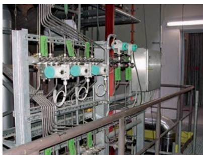
Geräterack und Schaltschrank

Ein weiteres Fachgebiet des Spezialisten ist die Elektro- und MSR-Montage. Die Fachkompetenz des Unternehmens in diesem Bereich sowie die hochqualifizierten Mitar-