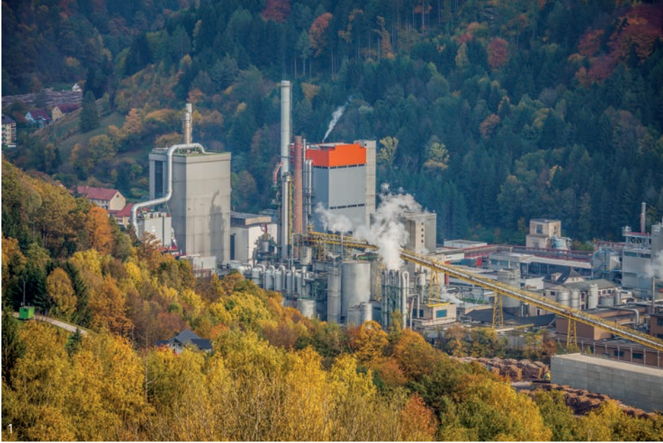
Mondi Frantschach ist Papier- und Zellstofflieferant für Verpackungshersteller und Verarbeitungsbetriebe auf der ganzen Welt.

Der regionale Vorzeigebetrieb, der rund 450 Mitarbeiter:innen beschäftigt und 2021 sein 140-jähriges Jubiläum begeht, produziert nicht nur bereits seit Jahren vollkommen energieautark, sondern versorgt mit der überschüssigen Wärme aus der Zellstoffproduktion auch umliegende Gemeinden und Industriebetriebe.