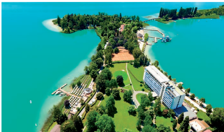
Inselfeeling mitten im schönen Kärnten

Das Parkhotel Pörtschach ist mit 195 Zimmern, Familienappartements und Suiten ausgestattet, alle stilecht aus- und umgebaut.