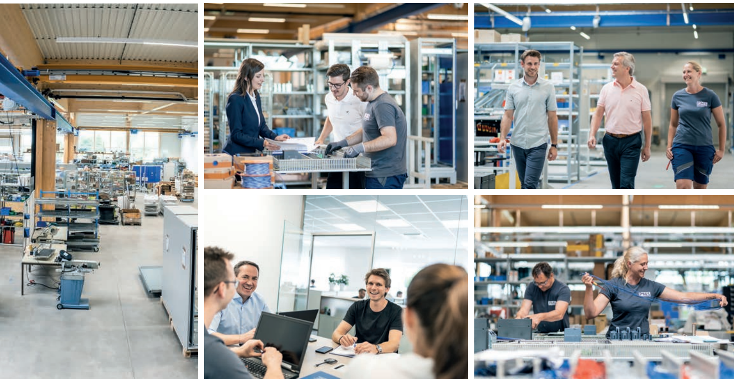
Im PMS Competence Center werden Schaltanlagen nach individuellen Kundenwünschen sowie Serienfertigungen für Industriekunden realisiert.

zusätzlich 60 neue Arbeitsplätze geschaffen. Hier werden von hochmotivierten und bestens geschulten Fachkräften Schaltschränke in höchster Qualität mit Hilfe von modernsten CAD-Systemen konstruiert. Unser Competence Center für Schaltanlagenbau ist sowohl für die Serien- als auch für individuelle Projektfertigung bestens ausgestattet.