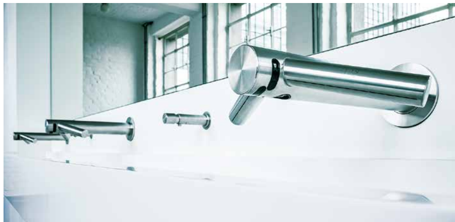
Der neue Dyson Airblade Wash+Dry Händetrockner: Kombiniert man einen Wasserhahn mit der Airblade™ Technologie, können die Hände direkt am Waschbecken mit hygienischer, HEPA-gefilterter Luft getrocknet werden.

(Weitere Informationen zur Berechnung der Betriebskosten finden Sie auf www.dyson.at/haendetrockner/kosten .)