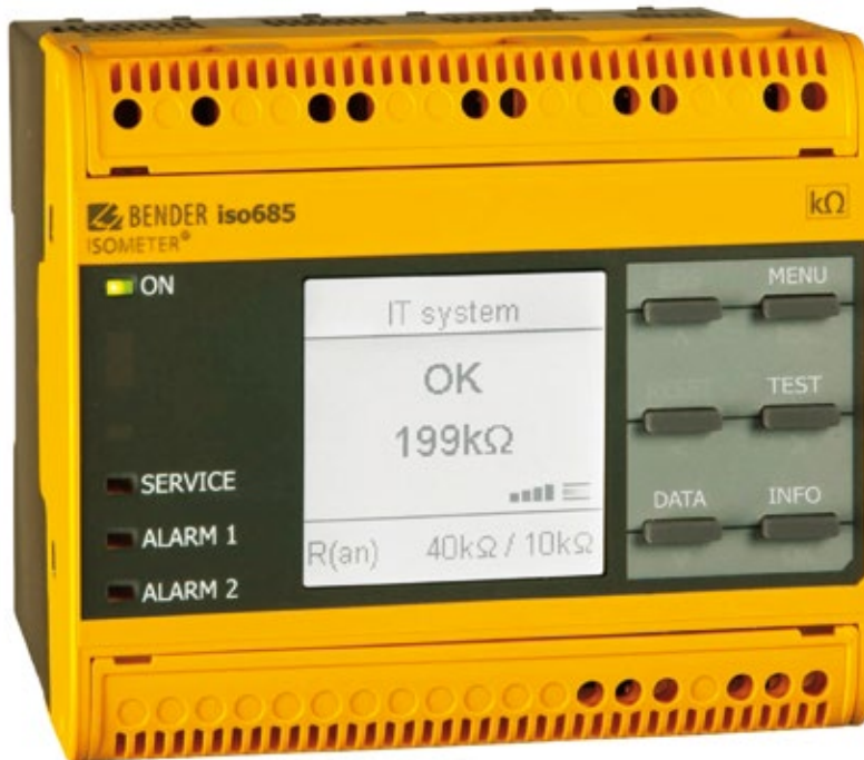
Frühzeitiges Monitoring von Isolationswiderständen bringt entscheidende Vorteile.

Die Überwachung langer, paralleler und kapazitiv gekoppelter Kabel stellt eine besondere Funktion des isoHR685 dar. Durch eine Art Synchronisierung werden durch benachbarte Überwachungsgeräte hervorgerufene Störungen unterdrückt und herausgefiltert. Somit ist es möglich, Kabel mit einer Länge von über 100 km zu überwachen, in denen verschiedene ungeerdete Stromversorgungen (IT-Systeme) geführt sind. Dabei spielt es keine Rolle, ob das IT-System als AC-, DC- oder AC/DC-Netz ausgeführt ist. Das eingesetzte AMP-Messverfahren kann in allen Systemen eingesetzt werden und bestimmt weiterhin die Netzableitkapazität. In solch langen Kabeln, wie man sie beispielsweise in der Öl- und Gasindustrie zur Versorgung der am Meeresboden installierten Ölförderanlagen vorfindet, werden Energie-, Hydraulik- und Kommunikationsleitungen in einem sogenannten umbilical cable zusammengeführt. Da diese Kabel kundenspezifisch angefertigt sind, sehr lange Lieferzeiten haben und zudem enorm teuer sind, ist es von großem